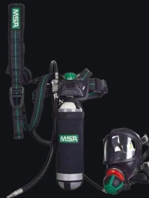
Дыхательный аппарат PremAir Combination