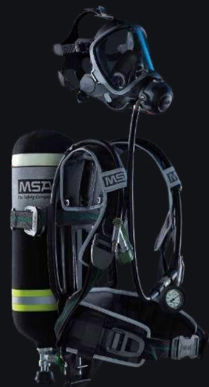
Дыхательный аппарат M1