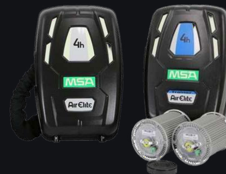
Дыхательный аппарат замкнутого цикла AIRELITE 4H