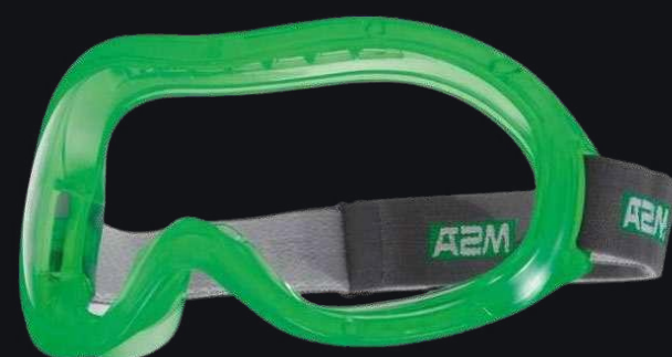
PERSPECTA GIV 2300