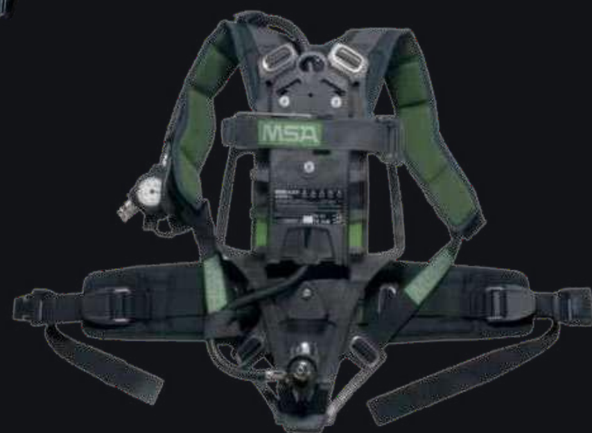
Дыхательный аппарат AIRGO