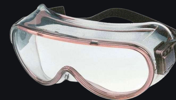
PERSPECTA GH 3001