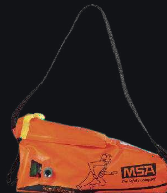
Аварийно-спасательный дыхательный аппарат на сжатом воздухе PremAire Escape