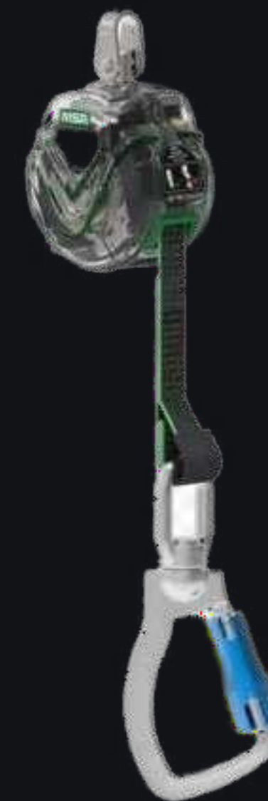
V-TEC™ Mini PFL