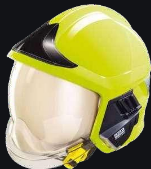
Пожарный шлем Gallet F1 XF